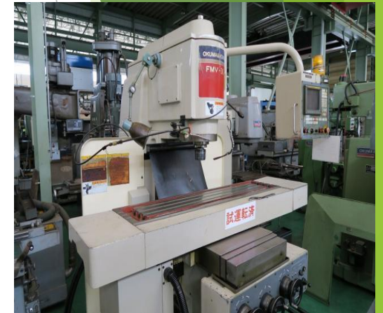
株) 大東通商から輸入した FMV-30