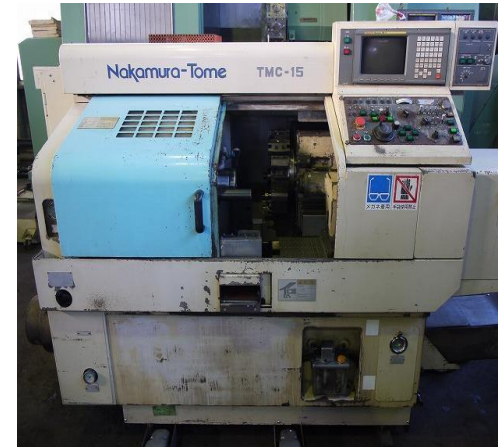
(株) 大東通商から輸入した TMC-15